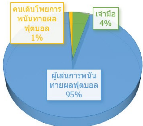
อ้างอิงข้อมูลจาก คณะพนักงานสอบสวนเพื่อสรุปผลการปราบปรามการลักลอบเล่นทายผลพนันฟุตบอลโลก 2018 สำนักงานตำรวจแห่งชาติ