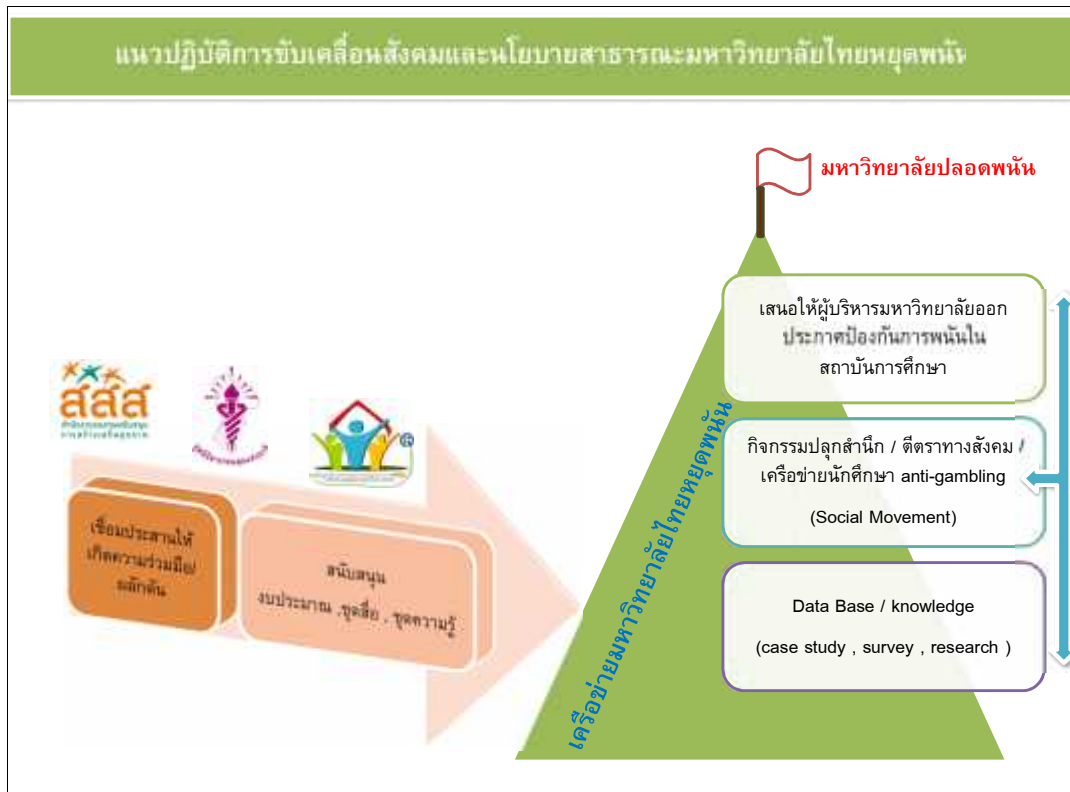
แผนภาพที่ 1.1 แนวปฏิบัติการขับเคลื่อนสังคมและนโยบายสาธารณะมหาวิทยาลัยไทยหยุดพนัน